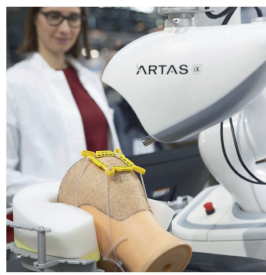
Branchentreff für Hersteller und Zulieferer

Innentitel werden von der Redaktion gestaltet. Damit Ihr Bild auf einem Innentitel erscheint, stellen Sie uns mehrere Bilder zur Verfügung, aus denen die Redaktion ein geeignetes auswählt. Das Bild soll das Special-Thema visualisieren. Dargestellt wird ein Produkt in der medizintechnischen Anwendung oder Mensch(en) plus Technik.